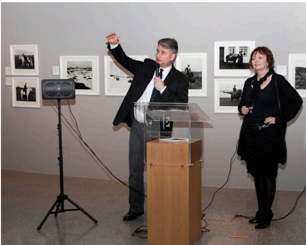
▲▲ Ljósmyndagreining á Húsavík. Snorri G. Sigurðsson, Menningarmiðstöð Þingeyinga. ◀ Sýningarsamstarf á myndum Bárðar Sigurðssonar. Ívar Brynjólfsson Þjóðminjasafn.

Sjálfbærni safnkosts byggir á söfnun á grunni markvissrar söfnunarstefnu, með stuðningi grísjunaráætlunar eftir því sem ástæða þykir til. Mikilvægt er að tryggja gildi safnkosts fyrir rannsóknir og miðlun með góðri skráningu og nýta aðferðir samtímasöfnunar þar sem það á við. Vinna þarf að því markmiði að safnkosturinn nýtist og að kostnaður vegna varðveislu sé í takti við þann ávinning sem samfélagið hefur eða mun hafa af honum.